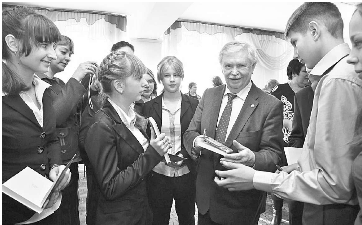
Альберт Лиханов в Грайворонской районной библиотеке

ПОЧЕМУ ЧИТАТЕЛЕЙ ПРОИЗВЕДЕНИЙ АЛЬБЕРТА ЛИХАНОВА МОЖНО НАЗВАТЬ НРАВСТВЕННЫМИ ЛЮДЬМИ