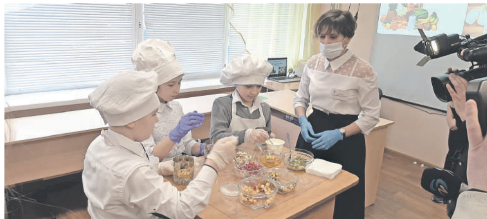
На внеурочке, посвящённой правильному питанию, ученики школы с УИОП готовят вкусные и полезные блюда