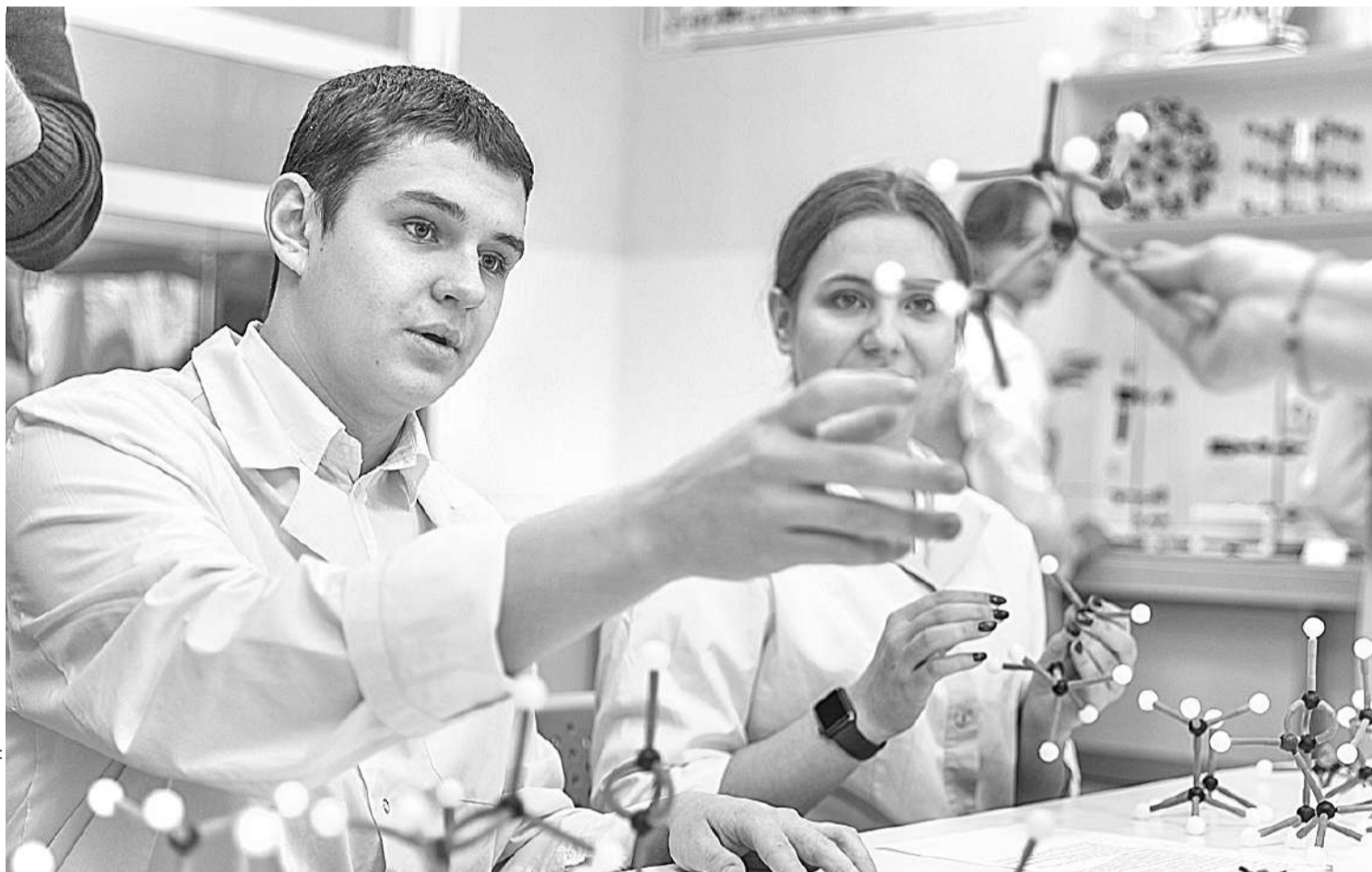
В химической лаборатории Шуховского лицея

В СОЦИАЛЬНЫХ СЕТЯХ ПОЯВЛЯЛОСЬ МНОГО СООБЩЕНИЙ О ТОМ, ЧТО СИТУАЦИЯ С КОРОНАВИРУСОМ — ЭТО ОСНОВАНИЕ ДЛЯ ПЕРЕВОДА ВСЕЙ СИСТЕМЫ ОБРАЗОВАНИЯ В ДИСТАНЦИОННЫЙ ФОРМАТ НА ПОСТОЯННОЙ ОСНОВЕ. УБЕЖДАТЬ НАРОД, ЧТО ТАКИЕ ЗАЯВЛЕНИЯ ОДНОЗНАЧНО БЕСПОЧВЕННЫ, НАМ СУЩЕСТВЕННО ПОМОГАЛ ОПЫТ ШКОЛ РАН, КОТОРЫЕ ПРОДЕМОНСТРИРОВАЛИ, ЧТО ОБРАЗОВАНИЕ — НЕ ТОЛЬКО ПРИОБРЕТЕНИЕ СУММЫ ЗНАНИЙ, НО ЭТО, ПРЕЖДЕ ВСЕГО, СОЦИАЛИЗАЦИЯ РЕБЯТ, ПЕРЕДАЧА ОПЫТА ПОКОЛЕНИЙ, ДУХОВНО-НРАВСТВЕННЫХ ЦЕННОСТЕЙ, ЧТО ЯВЛЯЕТСЯ НЕВОЗМОЖНЫМ БЕЗ ЛИЧНОСТИ УЧИТЕЛЯ, БЕЗ НЕПОСРЕДСТВЕННОГО ВЗАИМОДЕЙСТВИЯ С УЧЕНИКОМ, БЕЗ УЧАСТИЯ РЕБЁНКА В КОЛ-