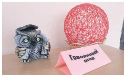
«Говорящий шар» в школе с УИОП. Ученики бросают в него свои отзывы и пожелания