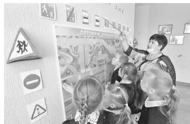
В Клименковской школе Вейделевского района

действию этих мероприятий на конкретного ребёнка сиюминутно, потому что результат, как правило, отдалён во времени, к тому же отсутствуют измерители воспитанности и сформированности навыка поведения на дороге. Но ни одна школа не стоит в стороне от этой работы.