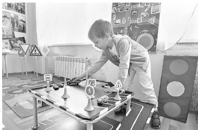
В детском саду «Сказка» пос. Ивня