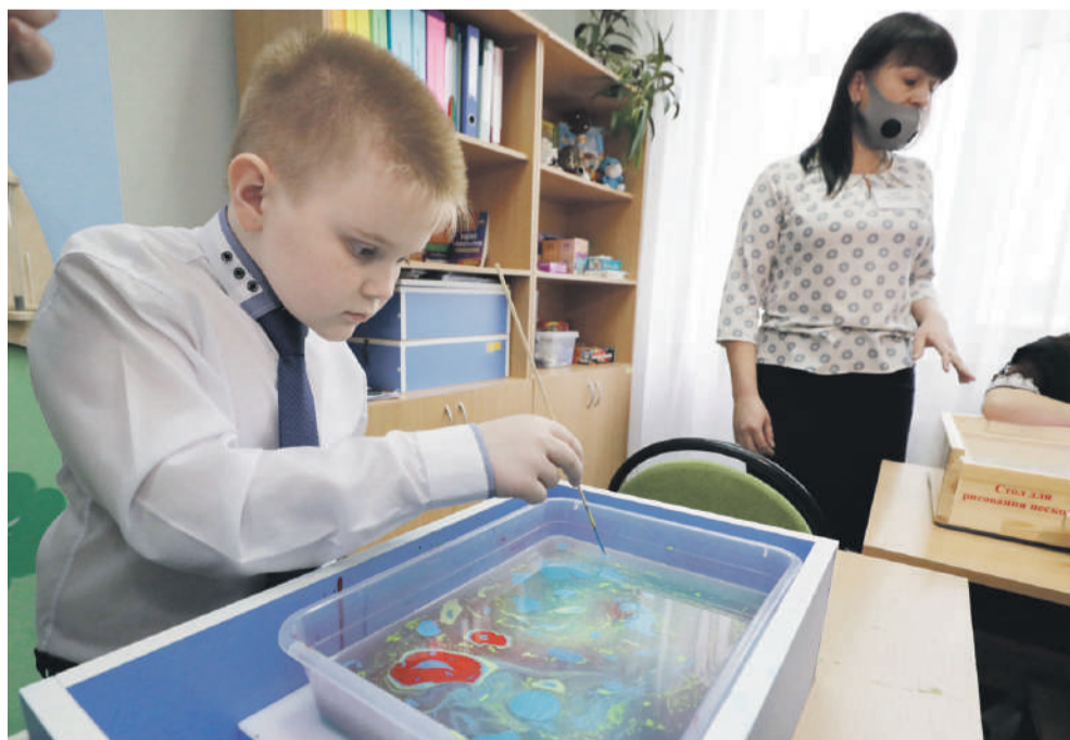
Занятие по акваанимации в Новоалександровской школе

Дальше директор ведёт нас в «деревню Йогуртово». Она расположилась в обычном классе, только вместо учебников и ручек на столе — йогурты, фрукты и другие начинки и добавки.