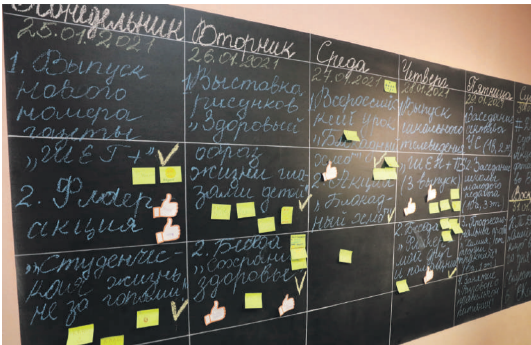
«Говорящая» стена в школе с УИОП