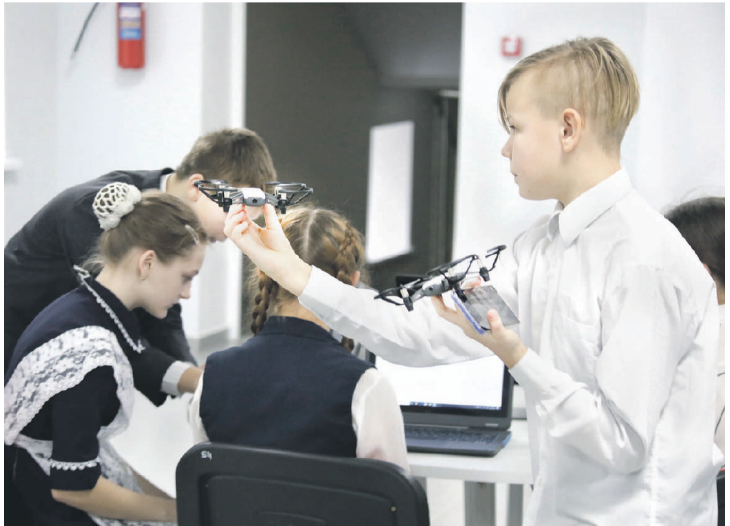
Квадрокоптерами сейчас даже в сельской школе никого не удивишь. С ними легко справляются в «Точке роста» Ровеньской школы № 2

На занятии внеурочной деятельности у младших школьников «Начинаем изучать английский язык» нам показали, как можно использовать флеш-карты (не компьютерные флешки, а карточки