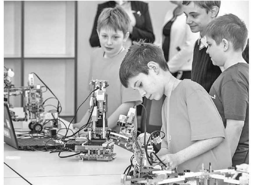
Студия робототехники Шуховского лицея