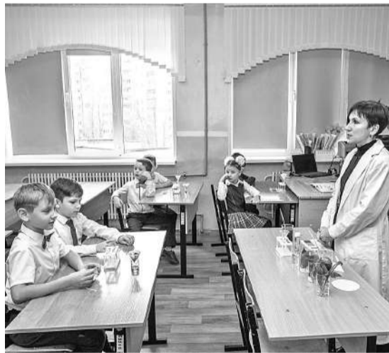
Шуховцы изучают кислотность почв