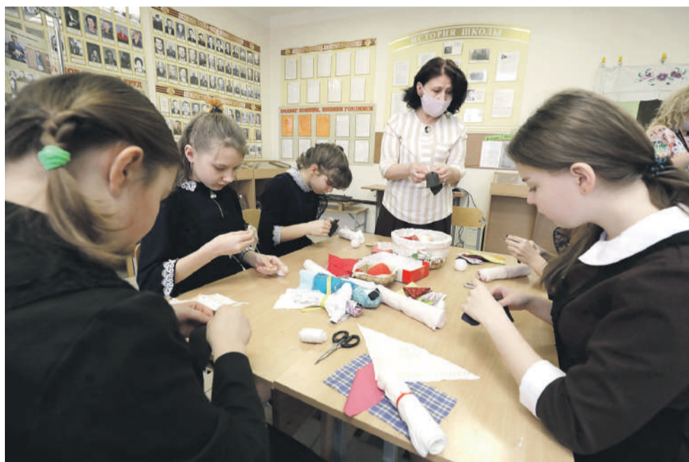
В рамках программы «Народная и авторская кукла» ученицы Новоалександровской школы учатся шить куклу-столбушку