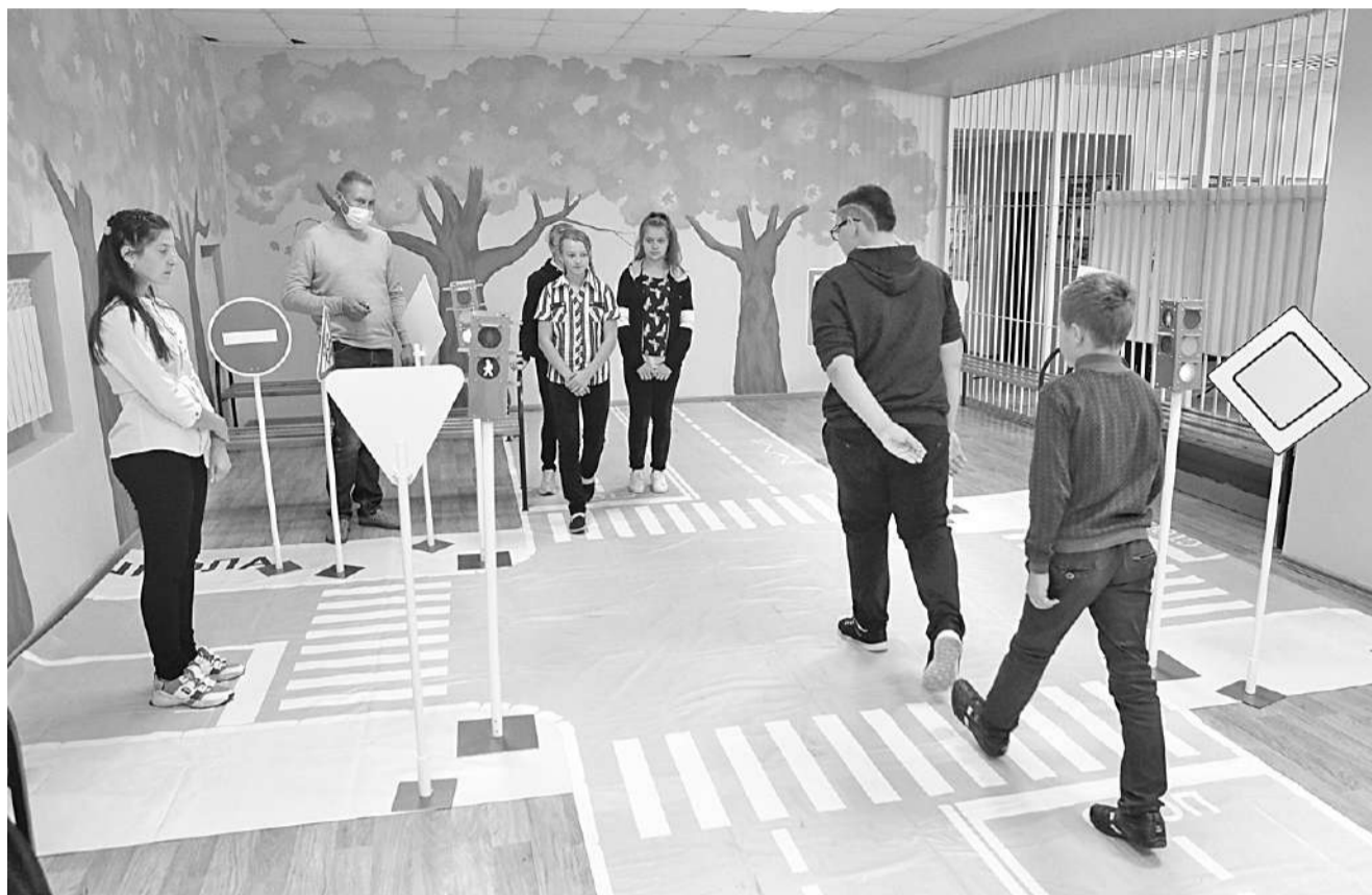
В Курасовской школе Ивнянского района

В наших школах во второй половине дня организованы пятиминутки безопасности перед уходом школьников домой, просмотр видеороликов, выступления агитбригад, проведение интеллектуально-познавательных и сюжетно-ролевых игр, целевых прогулок и экскурсий. Белгородская область принимает участие во всех всероссийских мероприятиях, которые рекомендованы Министерством просвещения Российской Федерации. Мы не можем делать выводы о воспитательном воз-