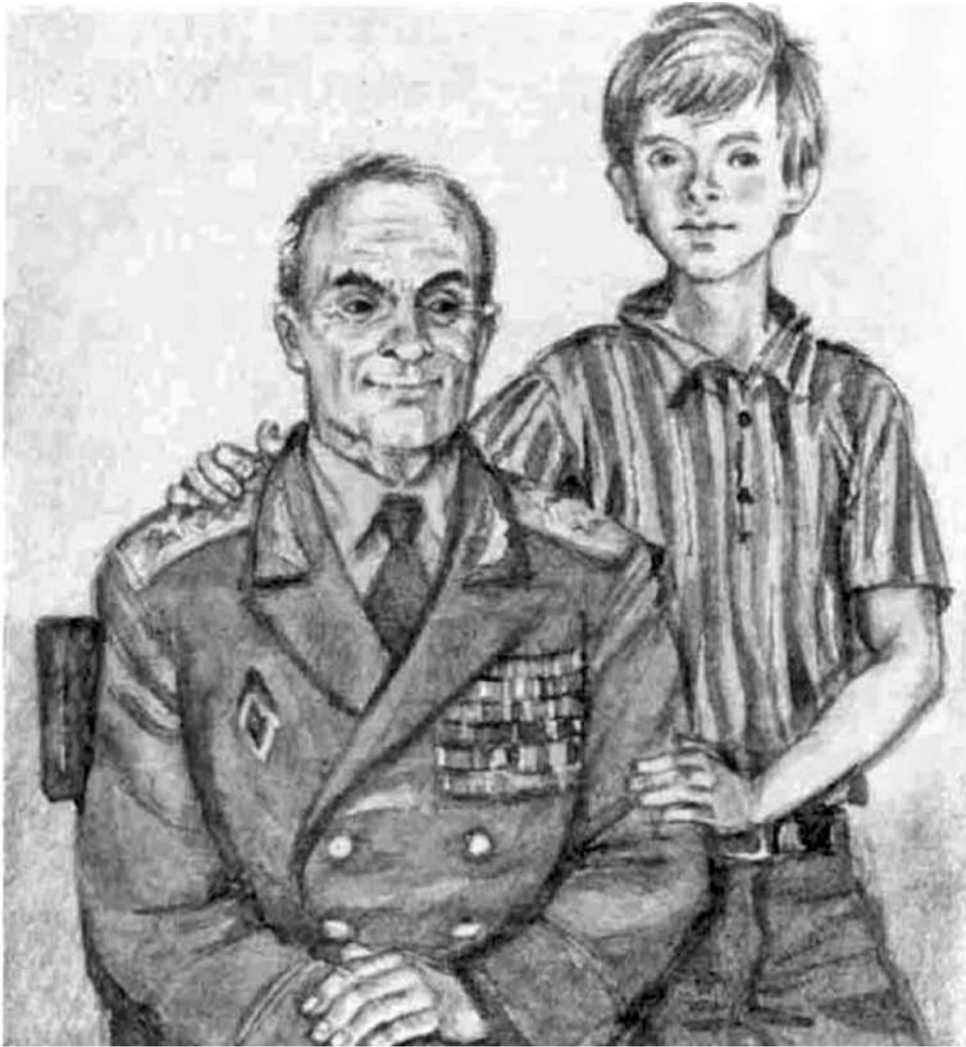
Иллюстрация к повести «Мой генерал» художника Юрия Иванова

ЧИТАТЬ СТАТЬЮ «ИСКАТЬ ДОБРО ВОКРУГ СЕБЯ» О КНИГЕ «НЕЗАБЫТЫЕ ИГРУШКИ»