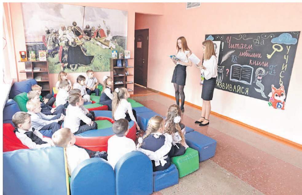
В рамках проекта «Дети — детям» старшеклассники читают книги ученикам начальной школы (Ровеньская школа с углублённым изучением отдельных предметов)