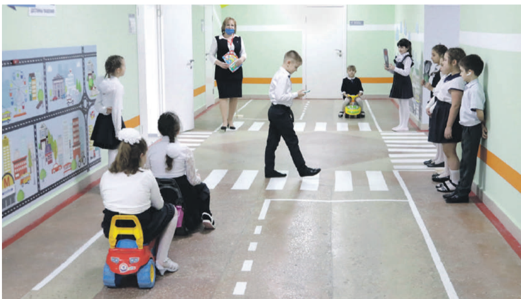
Занятия в образовательной зоне «Правила движения достойны уважения!» в школе № 2

ского творчества. Здесь занимаются и младшие школьники, для которых конструирование роботов — уже привычное дело. Как и для учеников школы с УИОП: в зависимости от возраста детей здесь действует два объединения дополнительного образования — «Робототехника» и «Введение в робототехнику».