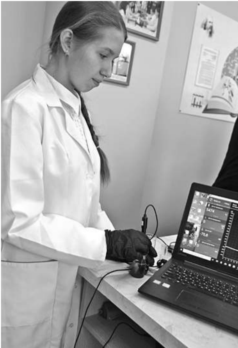
В школе № 1

КОЛЛЕГИ! МЫ ПРИГЛАШАЕМ ВАС СТАТЬ НЕ ТОЛЬКО ЧИТАТЕЛЯМИ, НО И АВТОРАМИ ГАЗЕТЫ!