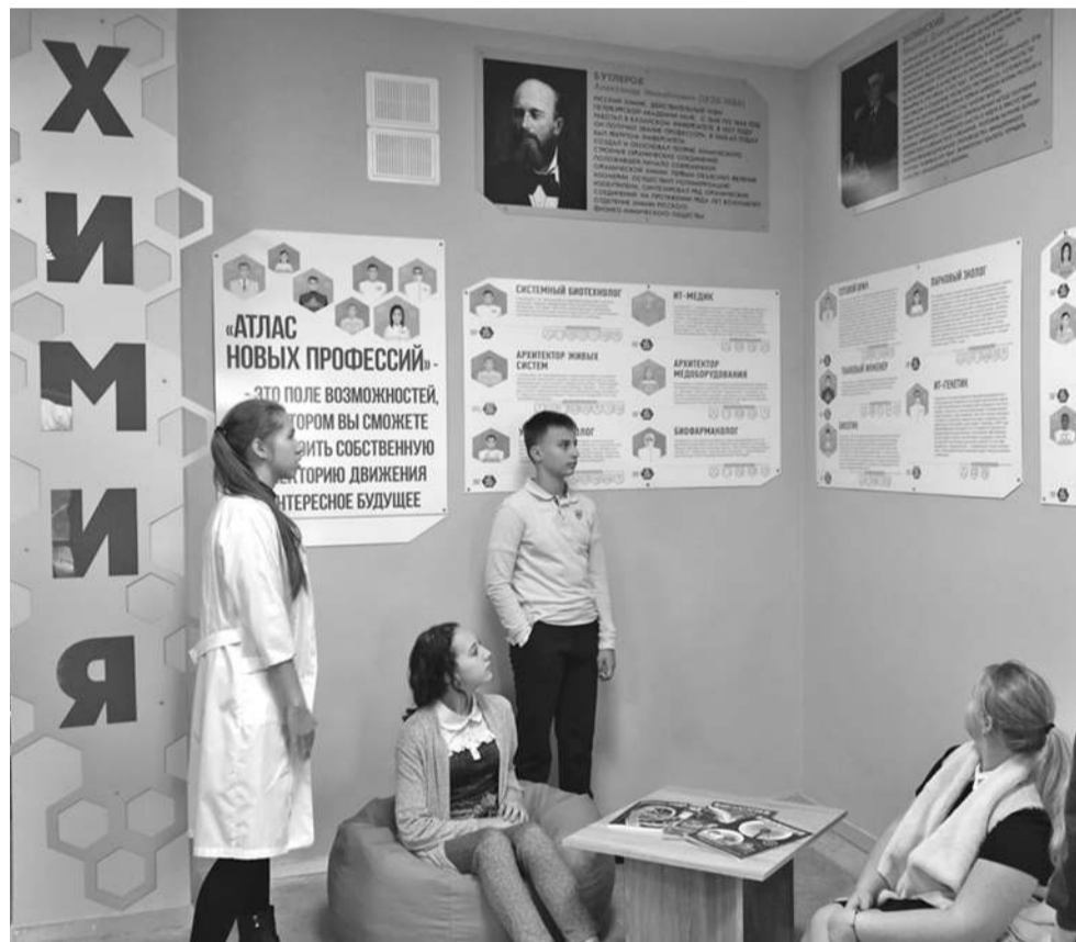
Профориентационная зона в школе № 1