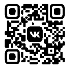
ПАБЛИК В СОЦСЕТИ «ВКОНТАКТЕ» HTTPS://VK.COM/KAFEDRA_DZOT

Созданная группа в соцсети позволит учителям физкультуры оперативно обмениваться лучшими практиками, делиться опытом регионов, конкретных образовательных учреждений.