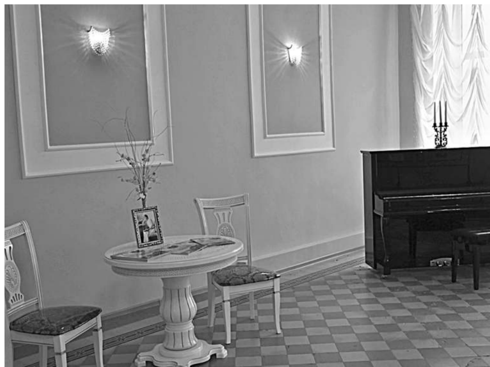
Ольгинский зал школы № 1