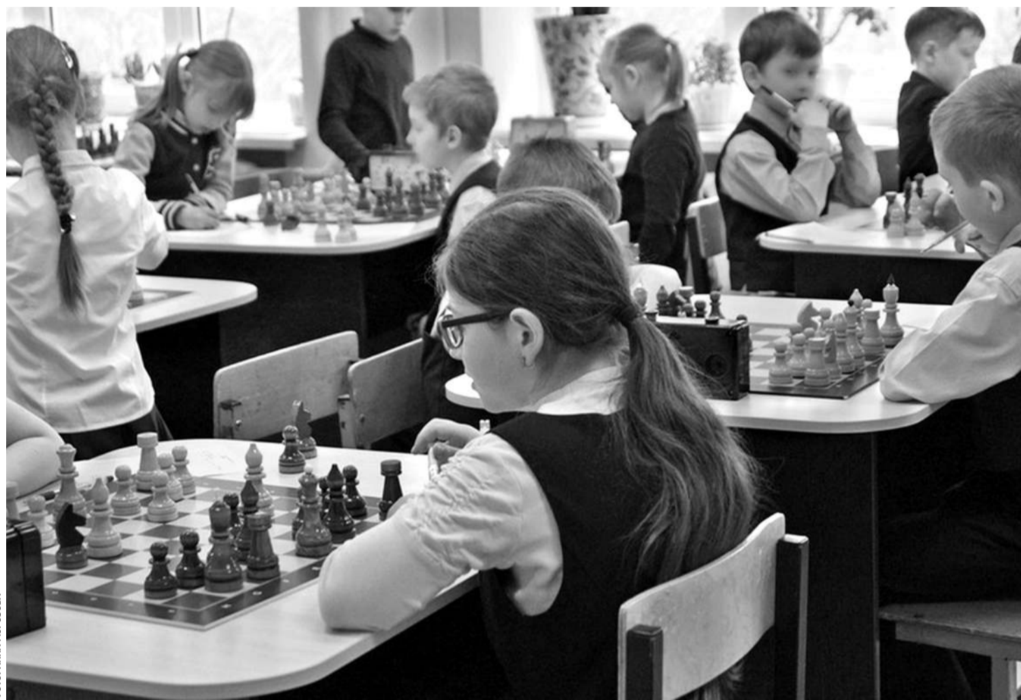
В образовательном комплексе «Луч»

— Высокий уровень локального нормотворчества. В этих учебных заведениях есть хорошо проработанные локальные нормативные акты, которые обеспечивают порядок. Основные образовательные программы и программы развития направлены на активное познание мира, развитие учебно-исследова-