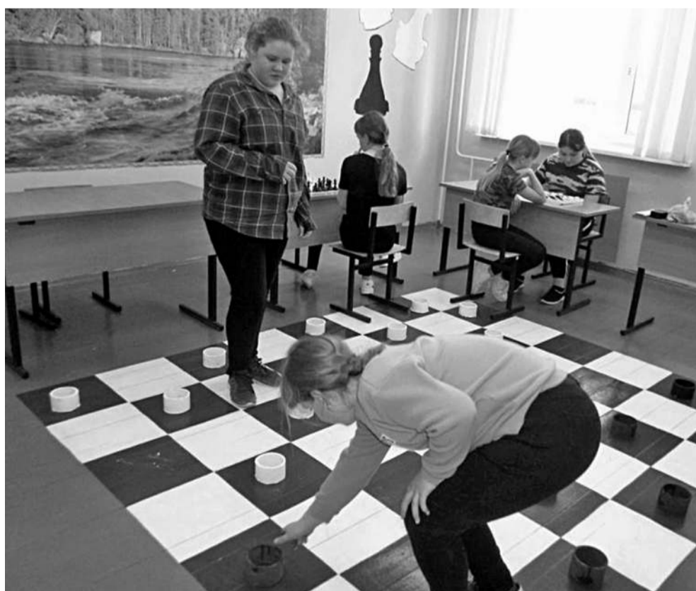
Игровая зона в Глинской школе