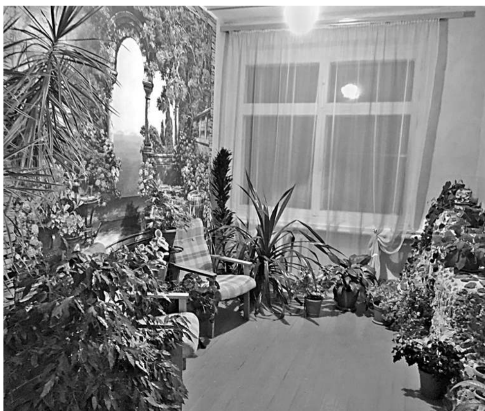
Зимний сад в Васильдольской школе