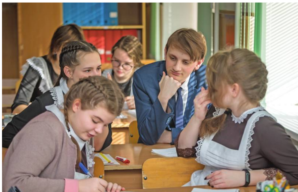
Урок обществознания в 10-м «Б» классе

Ольга МУШТАЕВА » ТЕКСТ