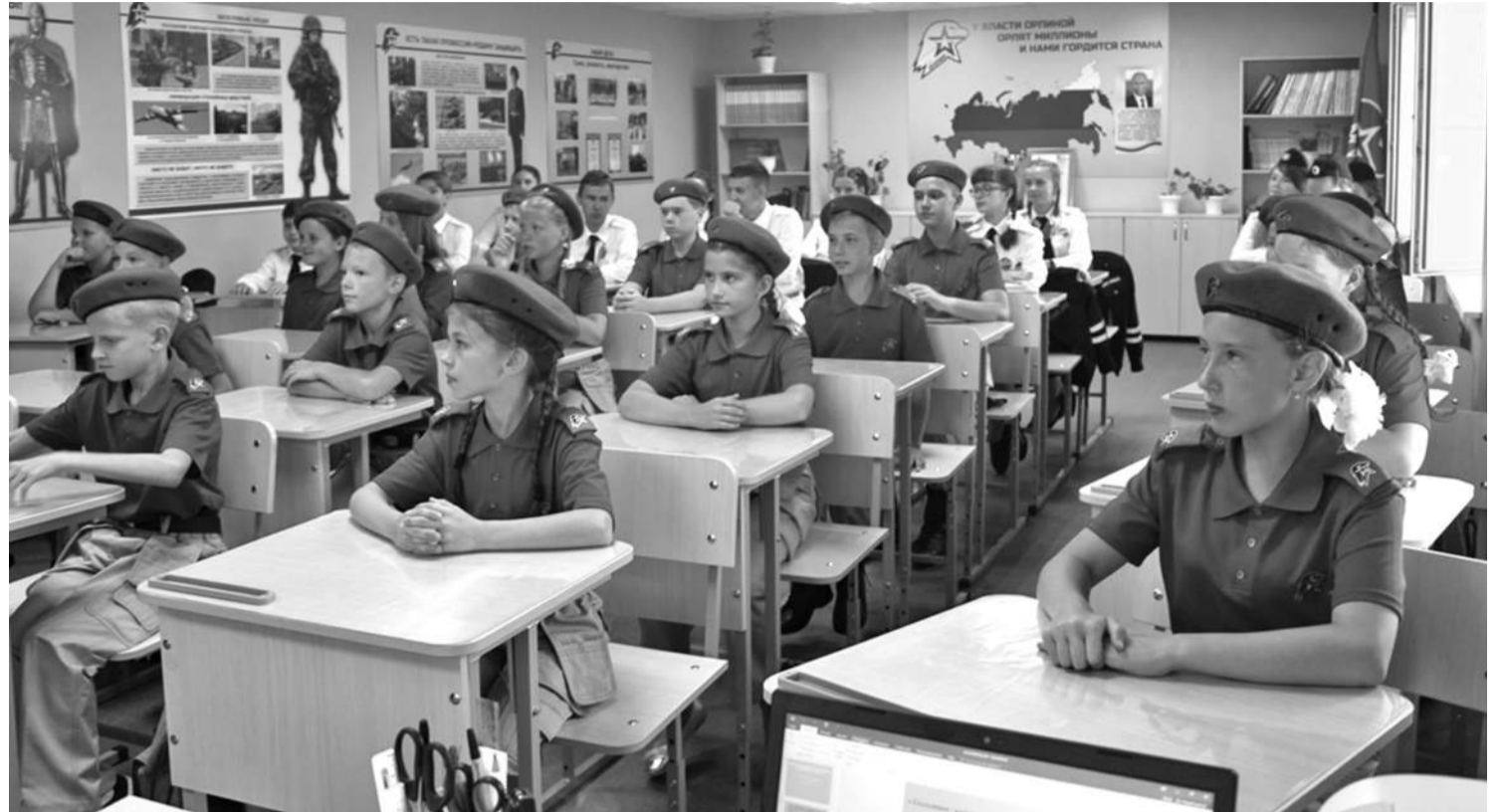
Кадетский класс школы № 1

В результате реализации проекта в школе создали лабораторию, которую можно без преувеличения назвать кузницей пытливых, талантливых юных исследователей. Ученики от четвёртого до выпускного классов занимаются наукой. В рамках постпроектной деятельности рядом с лабораторией оформлена развивающая зона «Химия занимательная и увлекательная», которая рассказывает об опытах,