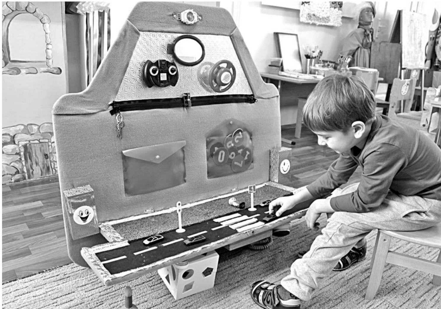
Игровая зона в детском саду № 8

СЕГОДНЯ СВОИМ ОПЫТОМ ДЕЛЯТСЯ УЧРЕЖДЕНИЯ ОБРАЗОВАНИЯ НОВООСКОЛЬСКОГО ГОРОДСКОГО ОКРУГА