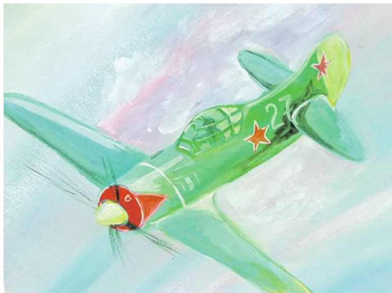
Воздушный бой. Рисунок Дмитрия Новикова (Корочанская школа им. Д. Кромского)