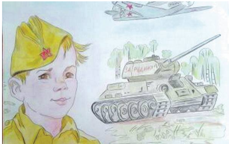
Рисунок Дарьи Лопиной (Корочанская школа им. Д. Кромского)