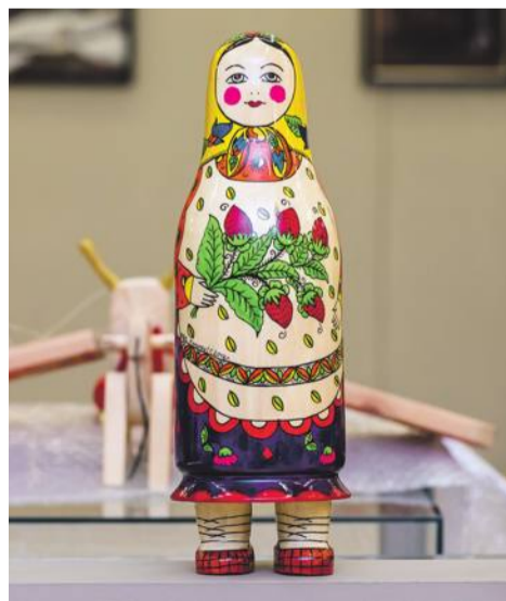
Матрёшка на ножках

А ещё на выставке вы увидите своеобразную «японскую матрёшку» — кокэси, характерная особенность которой — цилиндрическое тело с прикреплённой головой и отсутствие рук и ног. Эти куклы, покрытые росписью, появились в Японии ещё в XVII веке и до сих пор пользуются огромной популярностью у японцев самого разного возраста. Любопытно, что заготовки для этой куклы делают в России!