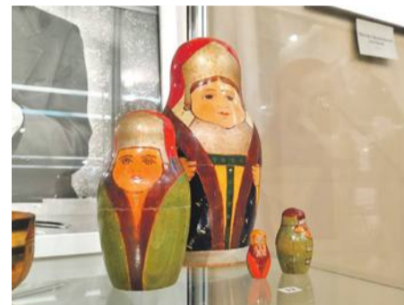
Набор матрёшек «Боярыни» (1910-е гг.)