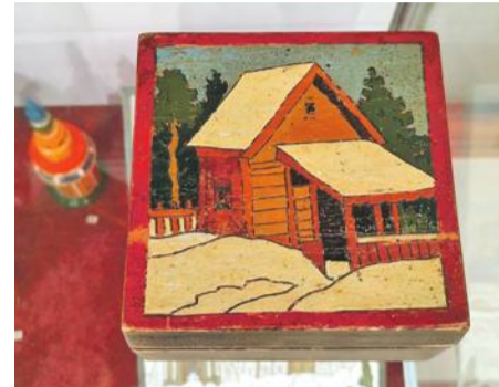
Шкатулка-коробочка «Зима в деревне» (1930-е гг.)