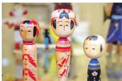
Японские куклы кокэси