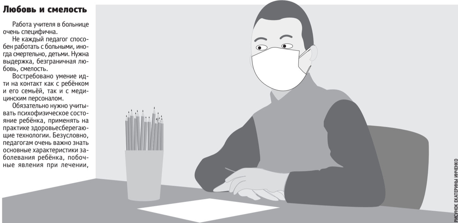
РИСУНОК ЕКАТЕРИНЫ ИЩЕНКО

Задачу педагогов вижу в том, чтобы они помогли детям не отстать от своих одноклассников в освоении программного материала.