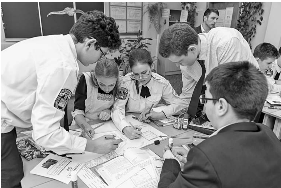
Заполнение ментальной карты