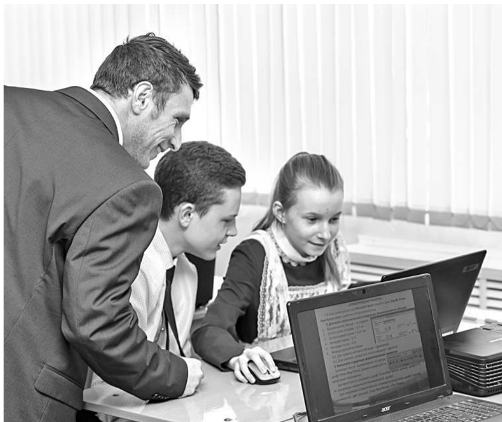
Ребята выполняют практическое задание на компьютере

Учитель раздаёт ребятам карточки с вопросами: «Чему я научился за эту неделю?», «Какие вопросы для меня остались неясными?», «Какие вопросы