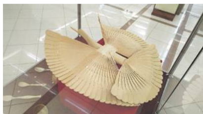
Архангельская щепная птица