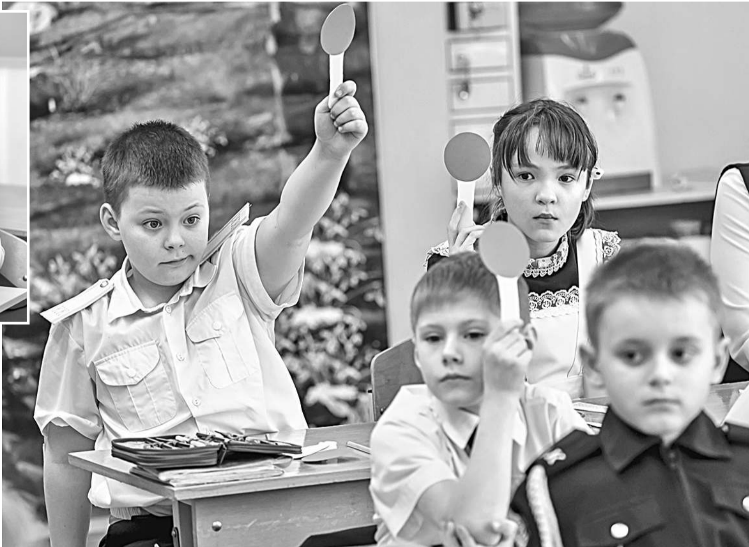
Использование техники «Светофор» в начальной школе