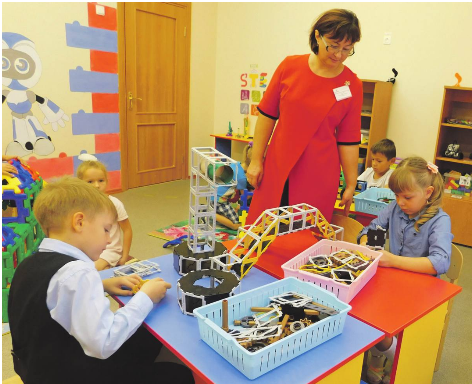
Инженерное образование малышей начинается с конструирования

Школьный технопарк позволяет создать эффективную систему профориентации, популяризировать среди школьников и их родителей востребованные инженерные и технические специальности. И, конечно, помогает выявить «техно-звёздочек» среди учеников в сетевом взаимодействии образовательных учреждений города.