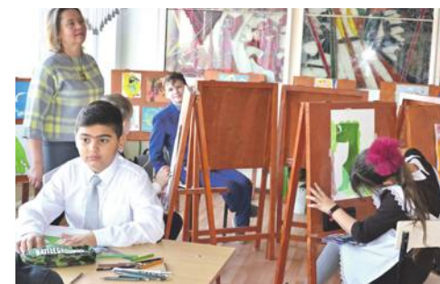
В изостудии школы № 4