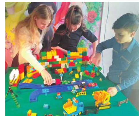
Студия мультипликации в Доме детского творчества