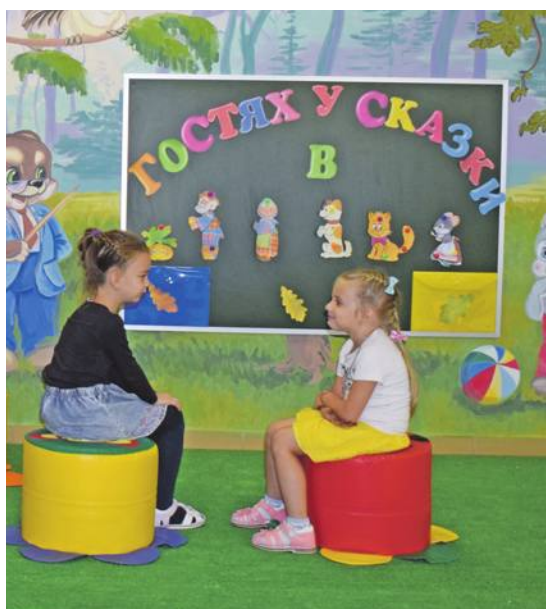
В детском саду № 4