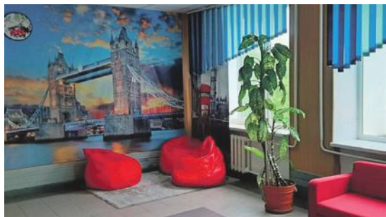
Рекреационная зона в школе № 1