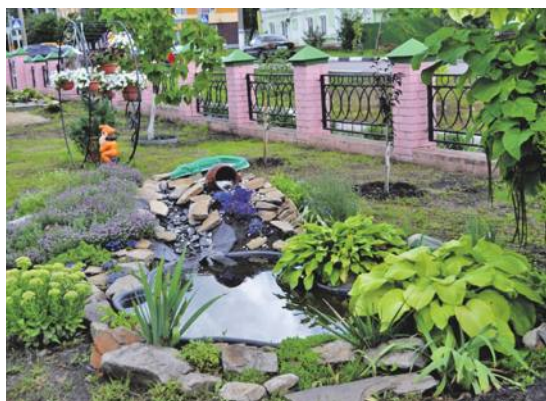
Ландшафтный дизайн на территории школы № 2