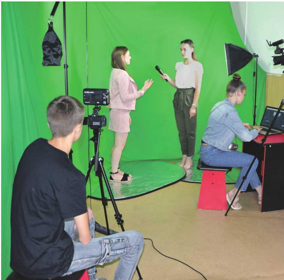
В школьном медиацентре «МедиаДикт» школы № 1