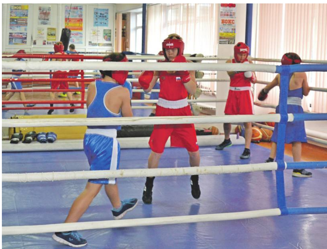
Тренировки по боксу в школе № 4