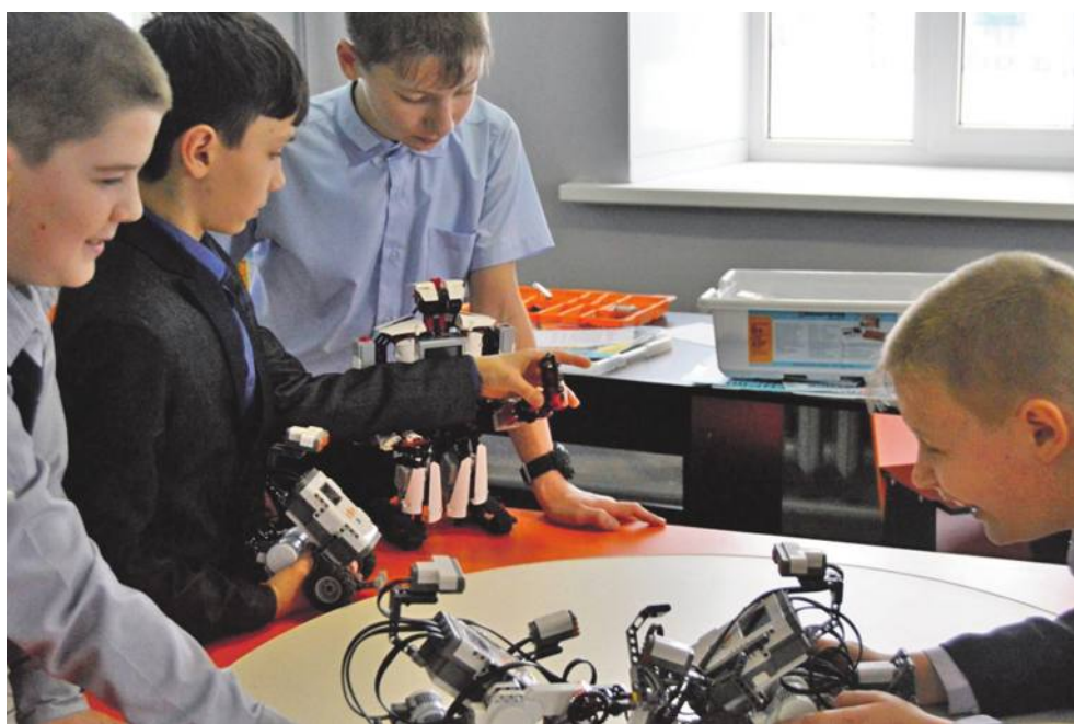
Технопарк в школе № 1

Ещё один важнейший элемент современной инфраструктуры — создание цифровой образовательной среды. Для решения проблемы взаимоотношений «цифровые ученики и нецифровые» учителя создали школьный медиацентр «МедиаДикт».