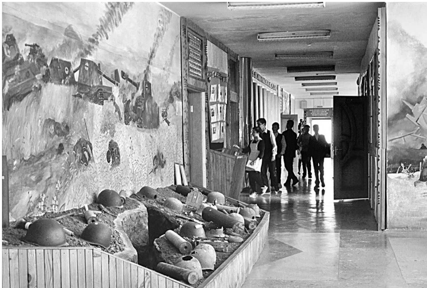
Школьный музей Великой Отчужденной войны