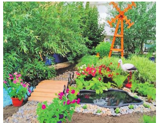
Рождественская школа Валуйского городского округа