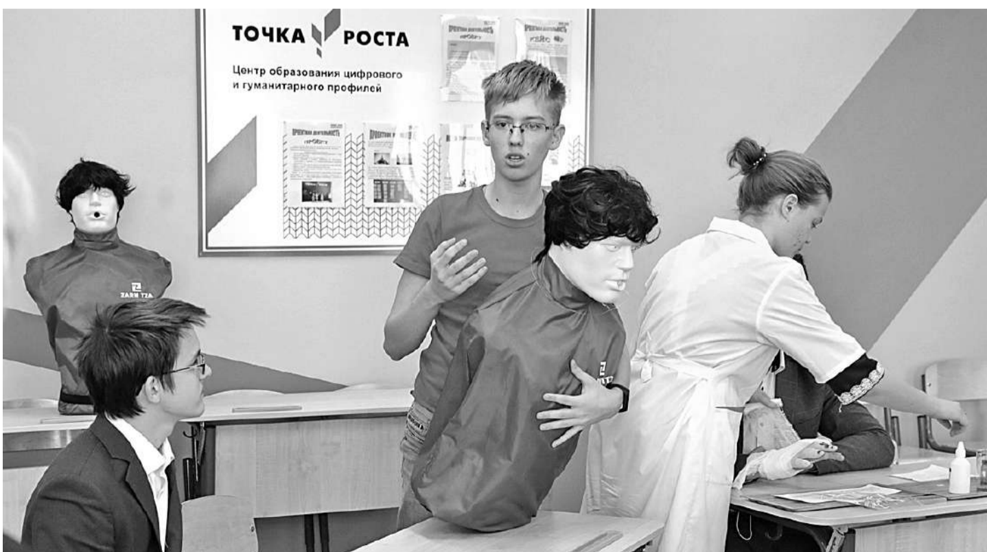
Оказывать первую помощь пострадавшим школьники учатся на манекенах-тренажёрах